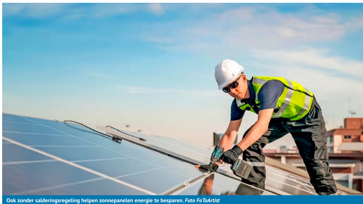
Ook zonder salderingsregeling helpen zonnepanelen energie te besparen.

Mabel studeerde bouwkunde en werd tijdens haar studie al warm gemaakt voor duurzame oplossingen. "Ik werk nu 3,5 jaar met veel plezier bij Regionaal Energieloket en ik heb de zonnepanelenmarkt helemaal zien veranderen. Toen de panelen goedkoper werden, waren ze niet aan te slepen. Door het stoppen van de salderingsregeling, stagneert de afname weer. Dat is zonde, want ook zonder de salderingsregeling zijn zonnepanelen vaak een goed idee. Tijdens de informatieavond vertel ik heel graag hoe dat zit. Ook deel ik tips en vertel