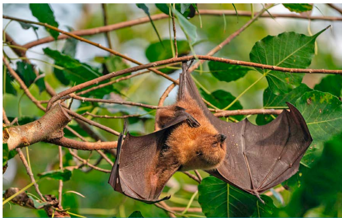
Vleermuis overdag in rusthouding aan een tak.

In het voorjaar en de zomer gebeurt er iets bijzonders: vleermuizen vormen kraamkolonies. Dat zijn sociale groepen vrouwtjes die samen hun jongen grootbrengen, ook wel puppy's genoemd.