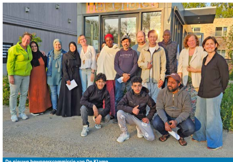
De nieuwe bewonerscommissie van De Klamp.