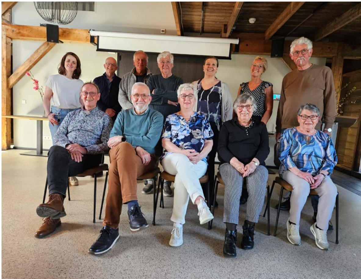
De klankbordgroep Senioren is ontstaan vanuit een duidelijke behoefte om met de gemeente samen te werken aan beter beleid.