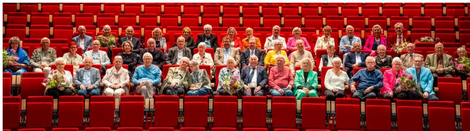
Deze echtparen vierden woensdag 20 mei hun huwelijksjubileum.

Maar liefst 22 echtparen gaven woensdag 20 mei acte de présence in het theatercafé van Cool kunst en cultuur, waar we de kwartaalviering hielden van Dijk en Waard vol Liefde!