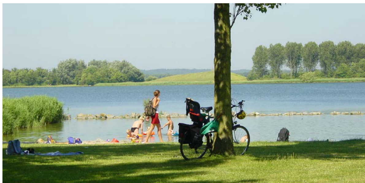
Ook deze zomer zal er door veel gezinnen weer worden genoten van zon en water op het Geestmerambacht.

Naast preventie komt de reddingsbrigade ook in actie bij incidenten. Vanuit de kazerne in Zuid-Scharwoude zijn lifeguards snel ter plaatse. "We zijn meestal binnen een kwartier op locatie. We werken samen met de brandweer en het duikteam uit Alkmaar. Ook zijn we aanwezig bij evenementen als de Drijf-In Bioscoop in het Kanaalpark." Alles gebeurt op vrijwillige basis. "Onze mensen doen dit naast hun werk. We helpen bij incidenten en evenementen, maar geven ook voorlichting. Dat maakt het werk afwisselend en belangrijk." Meer informatie over de Reddingsbrigade Dijk en Waard: rbdw.nl .