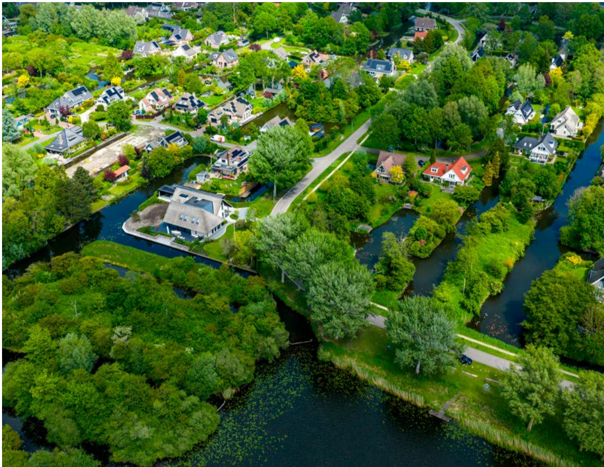
Het definitieve groenplan voor woonwijk Duizend Eilandenrijk is gepresenteerd.

Tijdens een bewonersbijeenkomst op dinsdag 19 mei in Museum BroekerVeiling is het definitieve groenplan voor woonwijk Duizend Eilandenrijk gepresenteerd. Ongeveer 40 geïnteresseerden kwamen naar de bijeenkomst om het plan te bekijken en vragen te stellen. De presentatie werd gegeven door Jos Smit van Smit Groenadvies en Arjen Wonink, beheerder openbare ruimte van de gemeente Dijk en Waard.