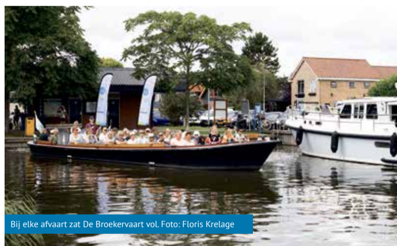
Bij elke afvaart zat De Broekervaart vol.

De gratis bootverbinding tussen Heerhugowaard en Broek op Langedijk heeft in totaal vier zaterdagen in augustus en september gevaren. De routes varieerden per dag en sloten vaak aan op zomerevenementen in gemeente Dijk en Waard. Iedereen kon gratis aan boord stappen om zo vanaf het water mooie plekken van de gemeente, zoals het Rijk der Duizend Eilanden en de havens, beter te leren