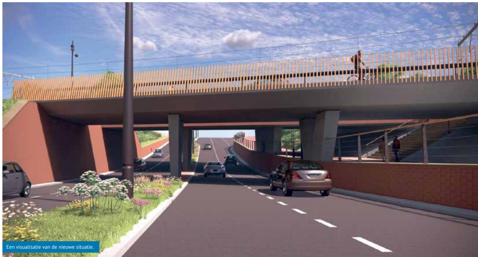
Een visualisatie van de nieuwe situatie.

De plannen voor de aanleg van de spooronderdoorgang van de Zuidtangent zijn bijna klaar. Naast de spooronderdoorgang wordt ook de Zuidtangent opnieuw ingericht, van de N242 (Westerweg) tot aan de Parelhof. Het doel is een aantrekkelijke, levendige en doorgaande route van het Stationsgebied naar het Stadshart. Met de herinrichting van het Stationsgebied krijgt Heerhugowaard een nieuw aanzien.