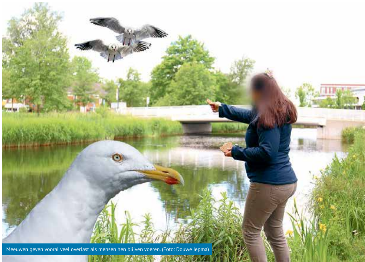
Meeuwen geven vooral veel overlast als mensen hen blijven voeren.

Kijk voor meer tips over hoe u zelf de overlast kunt tegengaan op www.dijkenwaard.nl/meeuwenoverlast . Via deze site kunt u ook uw melding van meeuwenoverlast aan ons doorgeven.