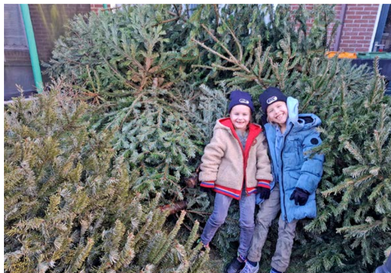
Lever net als Liv en Shay de kerstbomen van je burens in en verdien een lekker zakcentje!

Kerstbomen kunt u ook inleveren bij één van onze afvalafdelingsstations op bedrijventerrein Breekland aan Berrie 8 in Oudkarspel of op Beukenlaan 25 in Heerhugowaard. Vanaf 6 tot en met 10 januari ontvangt u hier bij het inleveren van de kerstboom ook 50 eurocent per boom. De kerstbomen kunt u natuurlijk ook voor of na deze datum inleveren bij de stations. De afvalafdelingsstations zijn geopend van maandag tot en met zaterdag van 08.00 tot 16.00 uur (gesloten op Nieuwjaarsdag 1 januari).