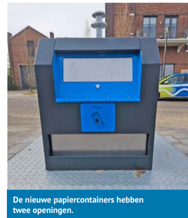
De nieuwe papiercontainers hebben twee openingen.

In de wijken en bij supermarkten in de gemeente staan ondergrondse containers voor papier en karton. Een aantal is vervangen voor nieuwe containers. Deze hebben twee openingen: de bovenste opening is voor papier, de onderste opening voor karton. De onderste opening is wat groter waardoor karton makkelijker in de container kan. Hierdoor blokkeert een grote doos de opening niet meer. Scheiden van papier en karton is op deze manier nog makkelijker.