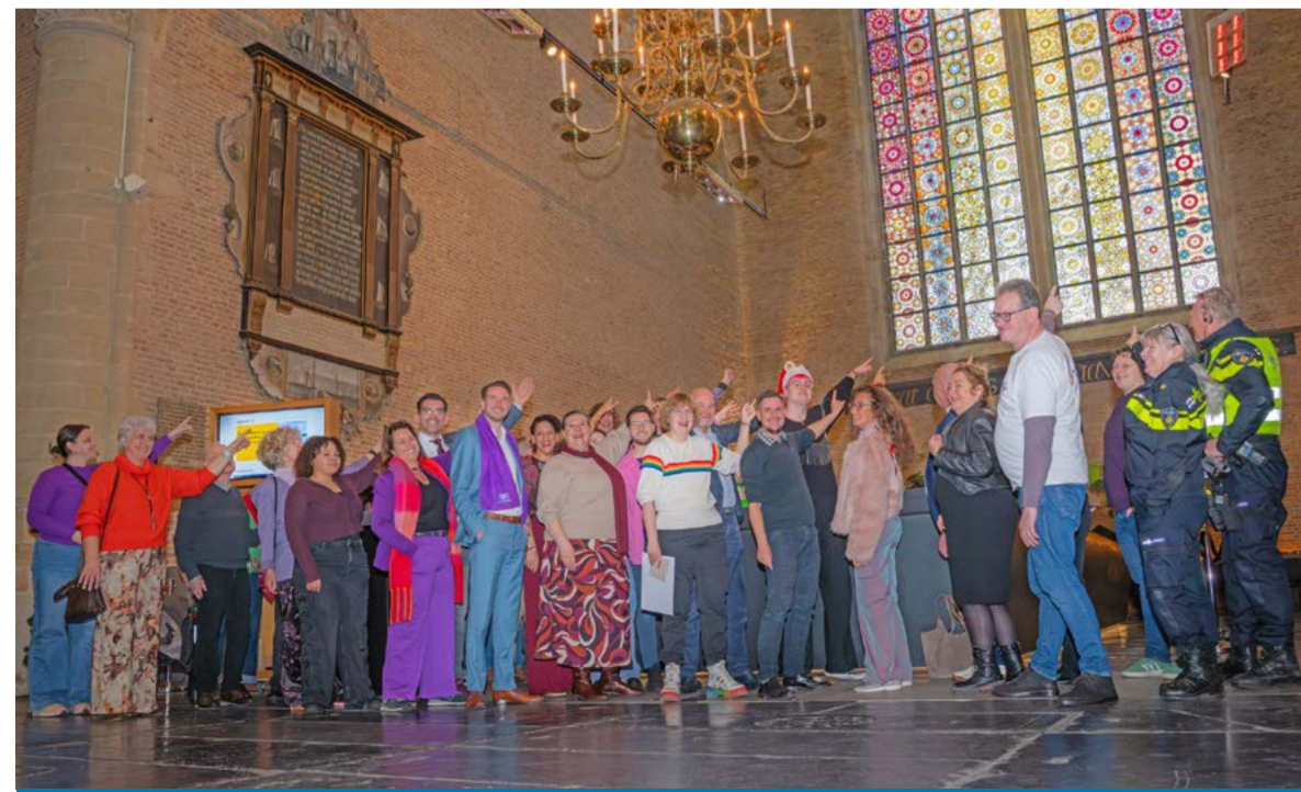
Op 12 december ontving de regionale regenbooggemeenschap een paneel uit het Grote Raam van de Grote Kerk in Alkmaar.

Op 12 december ontving de regenbooggemeenschap een paneel uit het Grote Raam van de Grote Kerk in Alkmaar. Dit gebeurde als blijk van waardering voor het platform Ergens op de Regenboog en zorgt voor blijvende zichtbaarheid van de regenbooggemeenschap. Het paneel staat symbool voor vrijheid, verbondenheid en kleur.