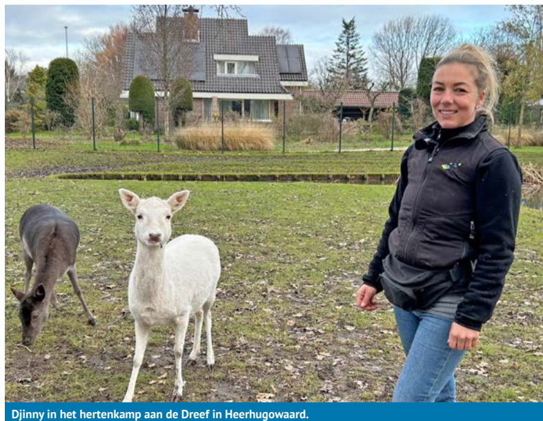
Djinny in het hertenkamp aan de Dreef in Heerhugowaard.