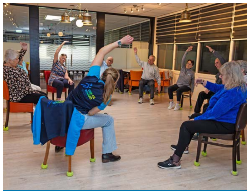
De buurtsportcoaches zijn actief om senioren sterker en zekerder te maken.