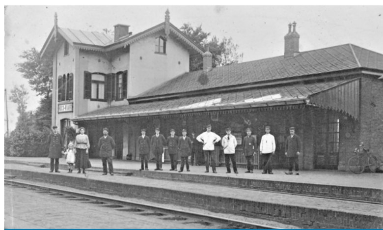
Het station van Heerhugowaard in 1865.