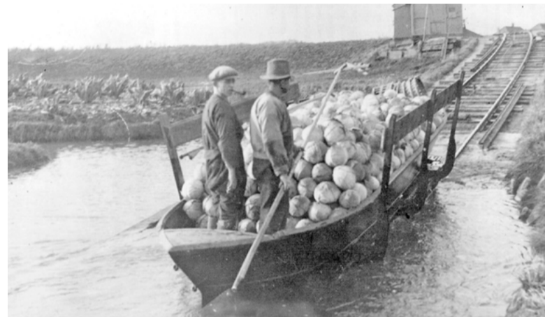
Het 'lijntje van Swager' zorgde voor een nieuwe manier van handel drijven.

Tot slot blikt hij vooruit op wat het project betekent voor Dijk en Waard. "De risico's van de oude overweg zijn weg, en het gebied is toekomstbestendig ingericht met veel aandacht voor groen en klimaat. Ook is er gewerkt aan een viaduct naast het spoor voor een veiligere verkeerssituatie. Het kruispunt Stationsplein-Zuidtangent is opnieuw ingericht met veilige fietsstroken en verkeerslichten. Het is een aanwinst voor de hele gemeente."