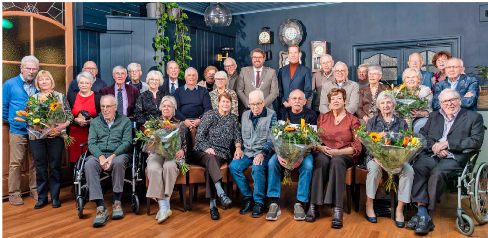
Woensdag 11 februari vierden 14 echtparen hun trouwjubileum in restaurant De Burg in Noord-Scharwoude.

Elk kwartaal nodigen we echtparen uit die in deze periode 60 of zelfs 65 jaar zijn getrouwd. Ook deze maand was het weer raak en woensdag 11 februari vierden 14 echtparen hun trouwjubileum in restaurant De Burg in Noord-Scharwoude.