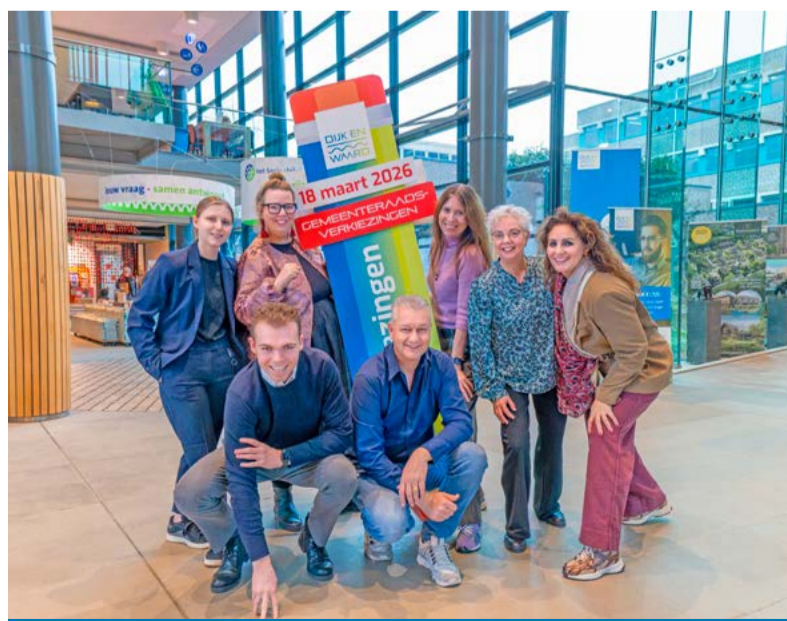
Team Verkiezingen van Dijk en Waard zorgt ervoor dat alles soepel verloopt.

Ook dit jaar biedt gemeente Dijk en Waard de mogelijkheid om te stemmen op bijzondere locaties of manieren. Zo is er een stembureau in Museum BroekerVeiling. In Komplex kunnen jongeren van 18 tot en met 27 jaar stemmen als een VIP. En voor ouderen organiseren we een stemochtend in zorgcentrum Arboretum, waar na het stemmen een praatje gemaakt kan worden onder het genot van een kop koffie met iets lekkers. Op het plein voor het gemeentehuis in Heerhugowaard wordt een stempaviljoen opgericht.