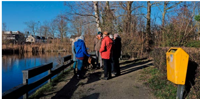
Het Fabritiuspark kan wel wat extra aandacht gebruiken.

Liever online? Lever uw idee, initiatief of wens aan via r.kruk@dijkenwaard.nl . Meer informatie: dijkenwaard.nl/fabritiuspark .