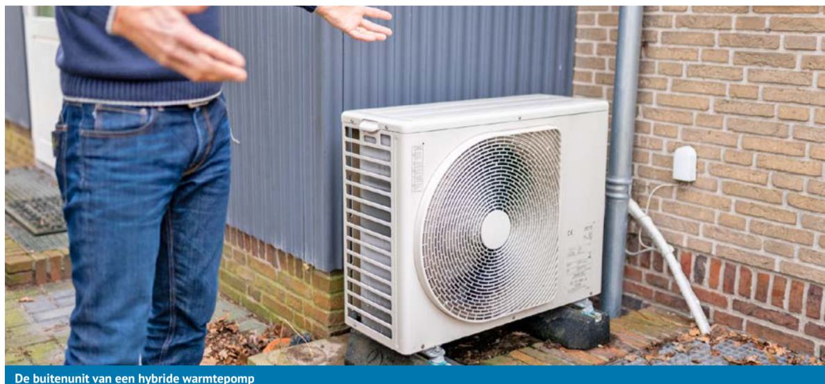
De buitenunit van een hybride warmtepomp

De soorten warmtepompen zijn vernoemd naar de bron waar ze hun warmte vandaan halen. Zo heb je de buitenluchtwarmtepomp, de bodemwarmtepomp en de ventilatiwarmtepomp. Daarnaast is er ook nog een hybride warmtepomp, die deels warmte onttrekt uit de buitenlucht en deels op gas via de cv-ketel werkt.