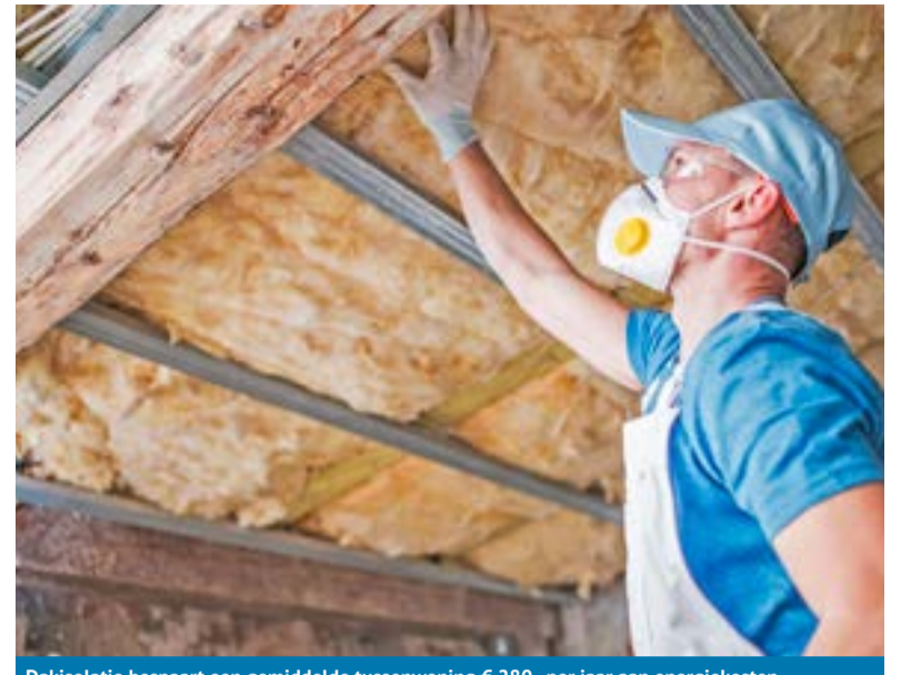
Dakisolatie bespaart een gemiddelde tussenwoning € 280,- per jaar aan energiekosten

Wat voor u de beste isolatiemaatregelen zijn, hangt af van uw woning. Als u niet weet waar te beginnen, kan een vrijwillige energiecoach u gratis advies aan huis geven. De coach loopt samen met u door uw woning. Stap voor stap wordt duidelijk waar uw