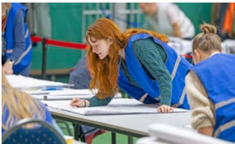
De gemeente zoekt stemmentellers.

Op woensdag 18 maart is het zover: de gemeenteraadsverkiezingen. Een belangrijk moment voor onze democratie, waarbij iedere stem telt. Wilt u daar zélf aan bijdragen? De gemeente zoekt vooral jonge inwoners van 18 jaar en ouder die willen helpen bij het tellen van de stemmen.