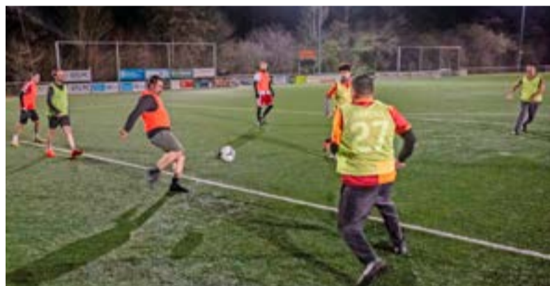
Vrijdag werd de eerste voetbalavond voor anderstaligen georganiseerd bij SVW.