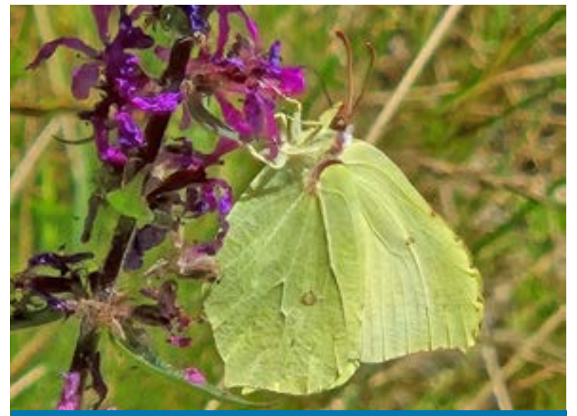
Vlinders kunnen onze hulp goed gebruiken in de winter

In de winter kan het gebeuren dat u ineens een vlinder in huis aantreft. Hij zoekt dan een nieuwe plek om te overwinteren. Maar let op: binnen is het te warm: de vlinder blijft actief en raakt uitgeput. U helpt hem door hem voorzichtig in een glas te vangen en buiten vrij te laten op een beschutte plek, zoals een schuurtje of onder een afdak. Daar vindt de vlinder zelf een geschikt plekje om veilig de winter door te komen.