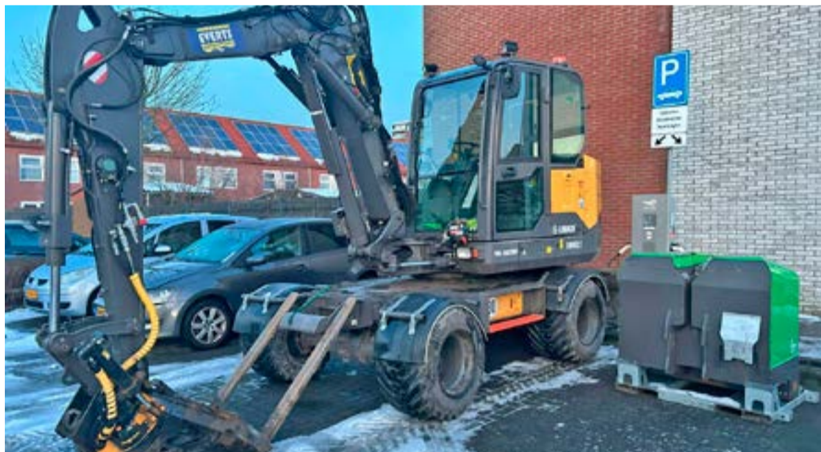
Mobiele graafmachine laadt op aan laadpaal in de Stad van de Zon

Een opvallend tafereel in de Stad van de Zon. Geen elektrische personenauto aan de publieke laadpaal, maar een mobiele graafmachine. Aannemer Schot Infra bouwde in opdracht van gemeente Dijk en Waard een verhoging van een kruispunt, met uitsluitend elektrisch materieel. Een stap in de goede richting naar Schoon en Emissieloos Bouwen (SEB).