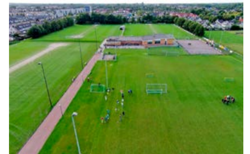
Elke vakantie worden de poorten van onder andere KSV open gezet zodat iedereen daar kan sporten.