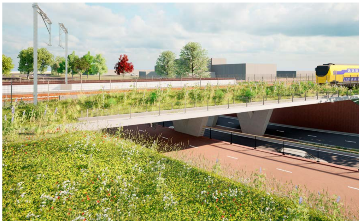
Van 10 tot 23 februari kon iedereen een naam kiezen uit de vier voorgestelde namen voor de spooronderdoorgang.

Meer informatie over het programma volgt in de komende weken.