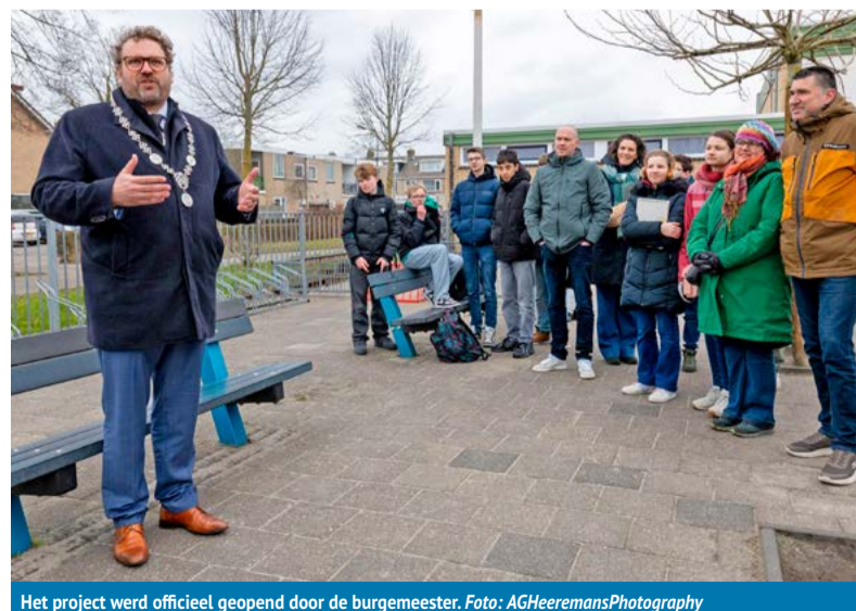
Het project werd officieel geopend door de burgemeester.

een kunstwerk, met een link naar een Romeinse godin. Als voormalig