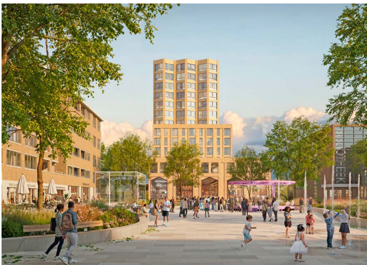
Het Stadshart, zoals het er in de toekomst mogelijk uit zou kunnen zien.