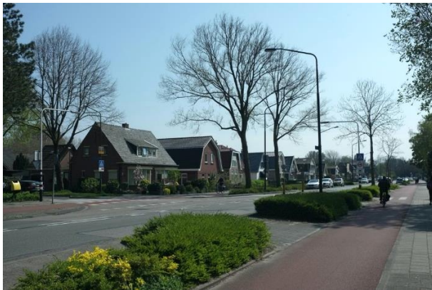
Afb. 7 : foto gemaakt richting hoek Middenweg/Van Veenweg. De bebouwing op vrije kavels, geeft openheid in straatbeeld. Dit refereert aan de historische opzet.