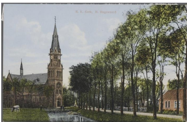
Afb. 5 : ingekleurde foto uit 1910 van de voormalige Dionysuskerk op de hoek van de Middenweg/Van Veenweg. Deze heeft plaatsgemaakt voor de Dionysuskerk uit de jaren 60. Opvallend is hierbij de bomenrij.