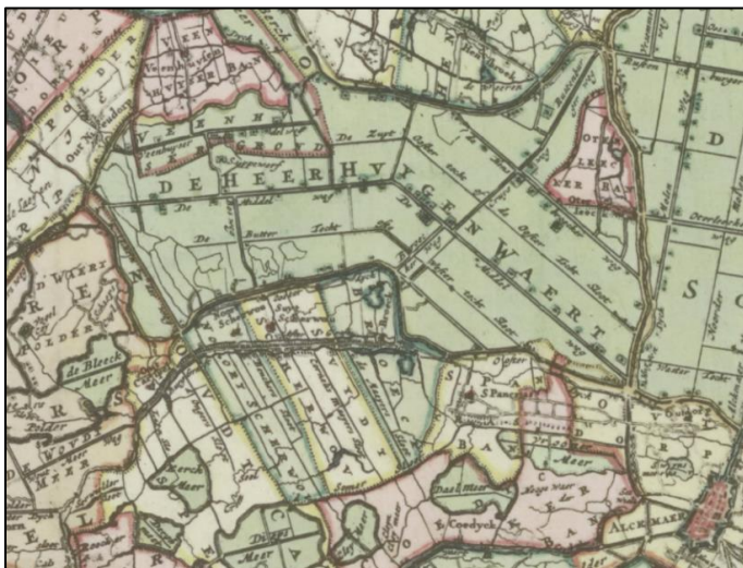
Afb. 1 : Op de Kaart van Uitwaterende Sluizen uit 1681 is de polderaanleg met wegenstructuur en eerste bebouwing goed zichtbaar. De kaart is op het oosten georiënteerd, waardoor het noorden links ligt.

Voor de drooglegging bestond dit gebied uit een binnensee, de Zuiderwaert, en had een directe waterverbinding met de Noordzee in Den Helder. In 1630 werd gestart met het inpolderen van de polder Heer Huigen Waert, na de drooglegging van de Beemster (1612) en als laatste De Schermer (1635). Zoals te zien op afbeelding 1 kreeg deze polder een aantal doorgangswegen, met de Middenweg als belangrijkste verbindingsweg. De bebouwing ontstond al snel, en de kaart uit 1688 geeft dat weer. De kenmerkende knik in de Middenweg had een reden: dit maakte een meest directe verbinding met Alkmaar mogelijk.