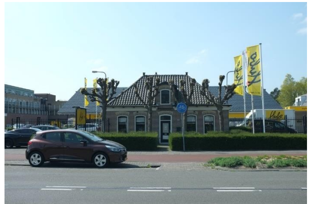
Afb. 8 de oude rentenierwoning aan de Middenweg 271. Vlaggen en parkeerplaatsen voor het pand verstoren het beeld.