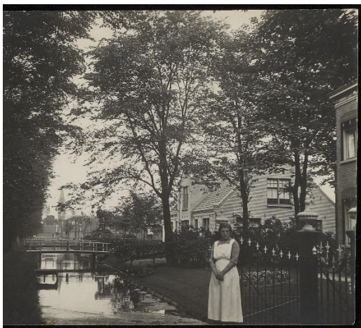
Afb. 3 : het voormalige armenhuis uit 1912 aan de Middenweg 200.

In de 19 de eeuw had de Middenweg een landelijk karakter. De weg was aan één zijde voorzien van een wegsloot, met bruggen naar de panden. Het had een groene opzet met bomenrijen langs de weg. Rond 1900 ontstond aan de Middenweg een wat duidelijker centrumlocatie, met kerk, raadhuis en winkels en woningen. Pas na 1960 maakt Heerhugowaard een grote groei door. Dit gaat gepaard grote stedenbouwkundige vernieuwing en sloop van diverse historische panden.