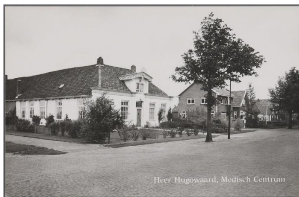
Afb. 6 : foto uit 1961 van het voormalige gemeentehuis uit 1835. Deze foto is gemaakt voor de grote uitbreidingsplannen van 1966, en geeft daarmee de oorspronkelijke klinkerbestrating weer.