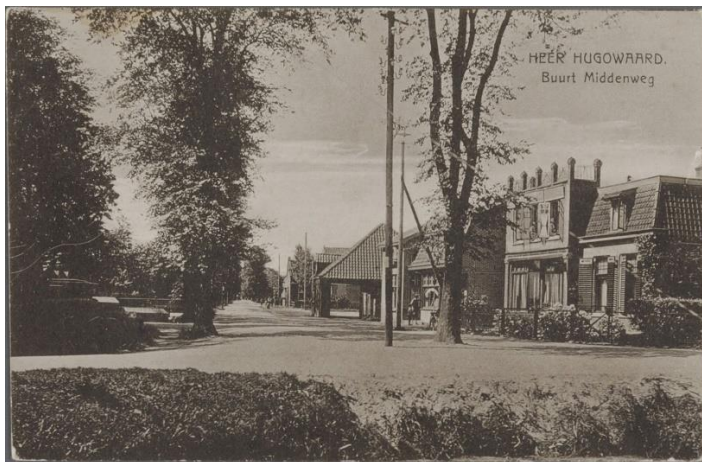
Afb. 4 : foto uit 1920 gemaakt op de hoek Middenweg/Van Veenweg. Opvallend is het pand met puntdak, wat als uitrijstal voor paarden diende. Deze konden geparkeerd worden bij bezoek aan het café/herberg. De bebouwing is inmiddels gesloopt.