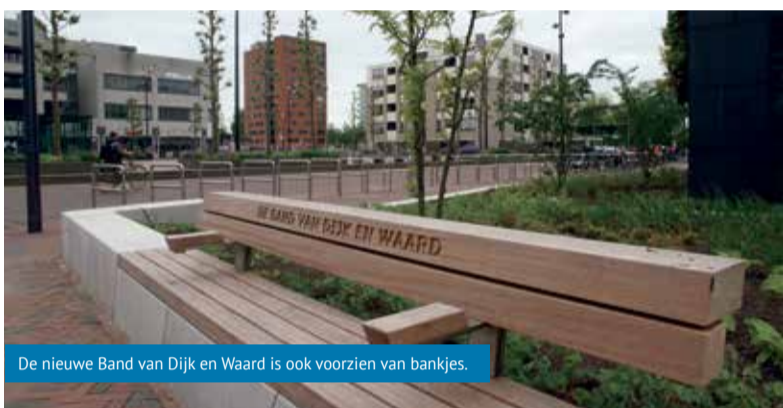
De nieuwe Band van Dijk en Waard is ook voorzien van bankjes.