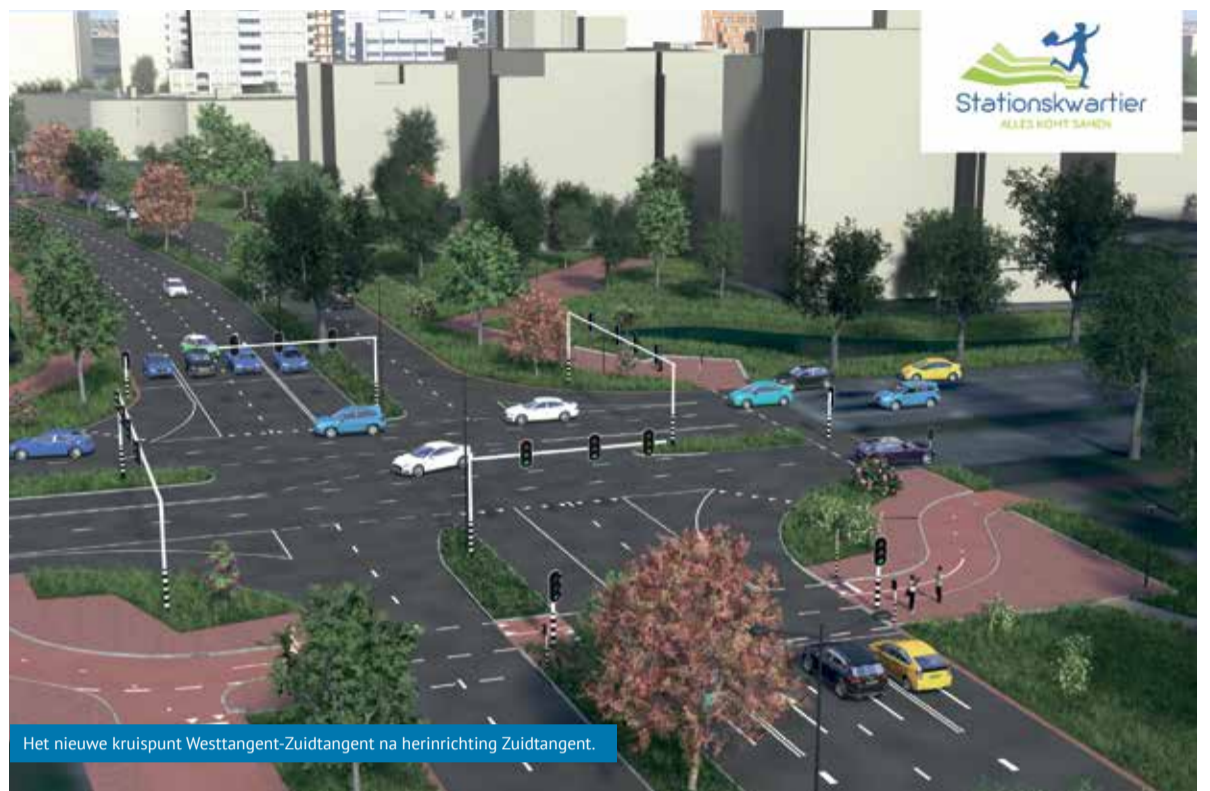
Het nieuwe kruispunt Westtangent-Zuidtangent na herinrichting Zuidtangent.

Tijdens de eerste inloopavond in april konden bewoners, ondernemers en belangstellenden hun voorkeuren aangeven op deze thema's. Mede op basis hiervan zijn vier praatplaten (ontwikkelmodellen) voor de toekomst van het station gemaakt. Het doel is om uiteindelijk één model te kiezen waarin alle voorkeurvarianten van thema's een plek krijgen. Tijdens deze