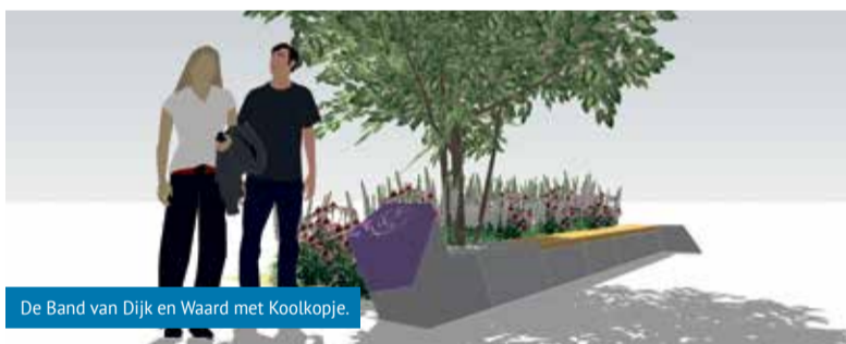
De Band van Dijk en Waard met Koolkopje.

gemeentehuis aan de Parelhof. Het Koolkopje is gemaakt van beton. Het is een vierkant blok met daarop de afbeelding van een kool.