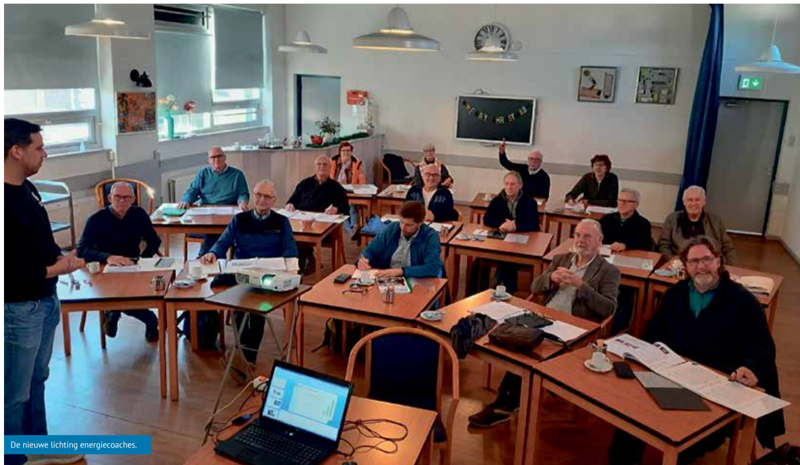
De nieuwe lichter energiecoaches.

Gemeente Dijk en Waard beschikt over een nieuwe lichter energiecoaches die inwoners geheel kosteloos kunnen helpen bij het verduurzamen van hun huis. Geïnteresseerde inwoners kunnen een beroep doen op de energiecoaches via het Duurzaam Bouwloket.