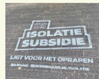
Green graffiti over isolatiesubsidie.

Vragen over de subsidies en het verduurzamen van huis of tuin? Ga dan naar www.dijkenwaard.nl/isolatie of kom naar het inloopspreekuur Duurzaamheid. Elke eerste dinsdag van de maand tussen 12.00 en 13.30 uur in de bibliotheek op Parelhof 1 in Heerhugowaard.