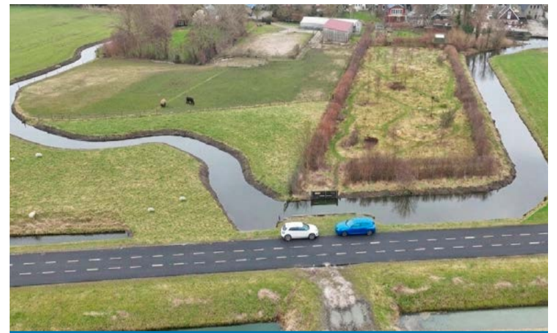
Nabij de Vronermeerweg komt een nieuwe watergang.

Kijk voor meer informatie op de projectpagina www.dijkenwaard.nl/vaarroute-vronermeerpad .