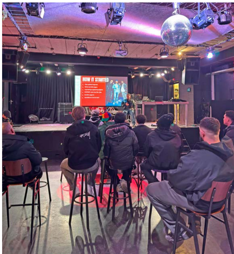
Jonge makers werkten intensief aan hun muziek, en deelden verhalen.