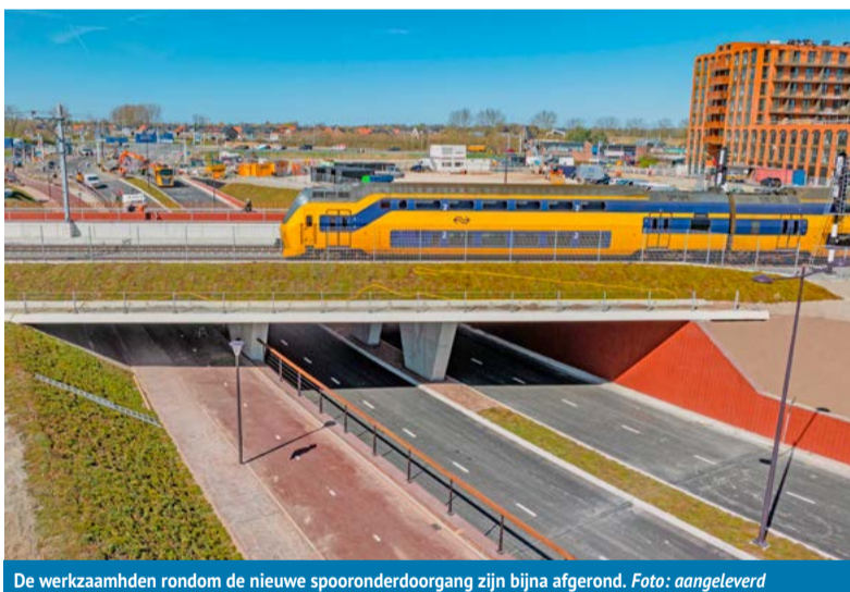
De werkzaamheden rondom de nieuwe spooronderdoorgang zijn bijna afgerond.

Er is beperkt parkeerruimte in de buurt. De ingang van het bouwterrein is bij Het Zakenstation, Stationsplein 99 in Heerhugowaard. Meer informatie op www.dijkenwaard.nl/opening