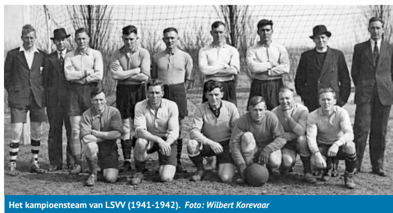
Het kampioensteam van LSVV (1941-1942).