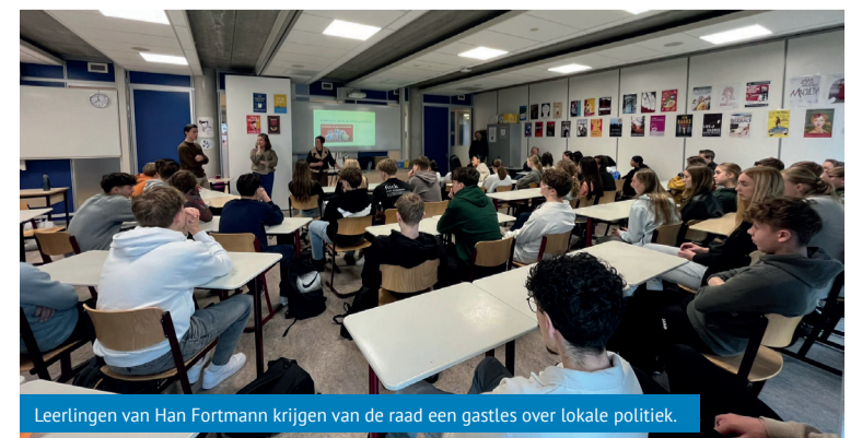
Leerlingen van Han Fortmann krijgen van de raad een gastles over lokale politiek.

De jongerengemeenteraad is op donderdag 7 maart, van 19.00 tot 22.30 uur in de raadzaal van het gemeentehuis. Kom naar de jongerengemeenteraad en luister naar wat jongeren te zeggen hebben. Of kijk mee via de livestream.