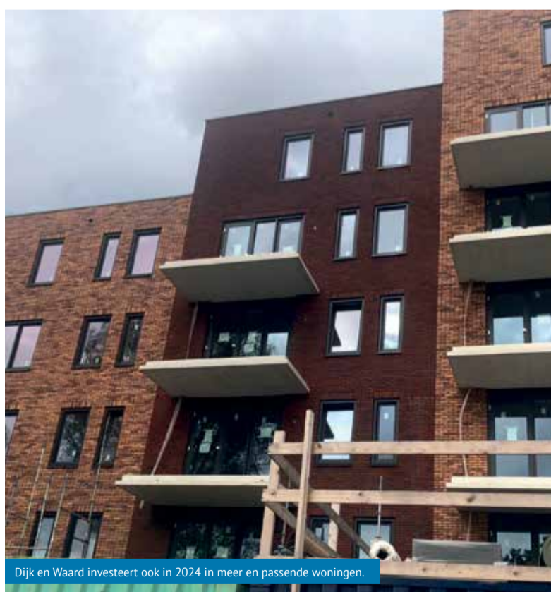
Dijk en Waard investeert ook in 2024 in meer en passende woningen.

Volgens de Programmabegroting investeert Dijk en Waard ook in 2024 fors in de vele lopende projecten die